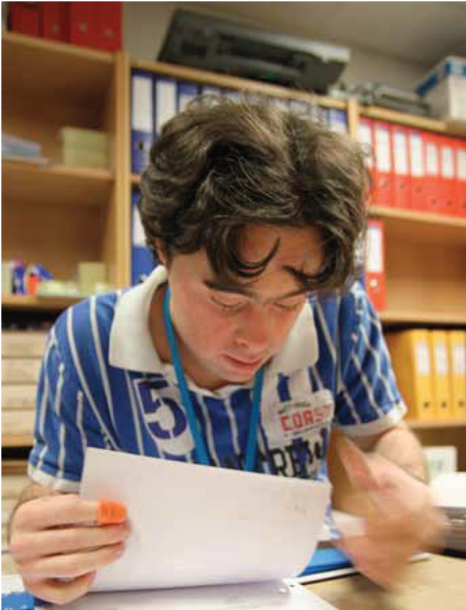
FULL FOKUS: Arkivering er en viktig del av arbeidet på Folkehelseinstituttet.