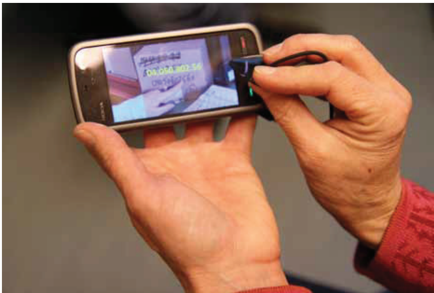
HUSKELAPP: Håndholdte instruksjonsfilmer, skal gjøre det enklere å repetere og huske nye arbeidsoppgaver.

av tre IKT- aspekter: Det skal lages film av arbeidsoppgaver som arbeidstakerne behersker godt. Disse skal de vise fram til den eksterne bedriften, slik at arbeidsgiverne ser hvor godt de mestrer arbeidsoppgaver som de er rutiner på. Dessuten skal de vise at de behersker moderne IKT-utstyr som nettbrett, sier Rødevand. Det andre aspektet i prosjektet er å bruke IKT i tilretteleggingen.