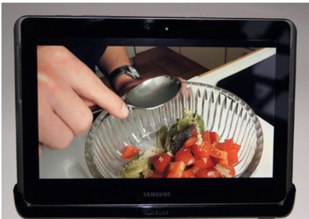
Her vises filmen «Avocadosalt på et nettbrett. Det var viktig å ha stativ. Eksterne høyttalere ble også brukt.