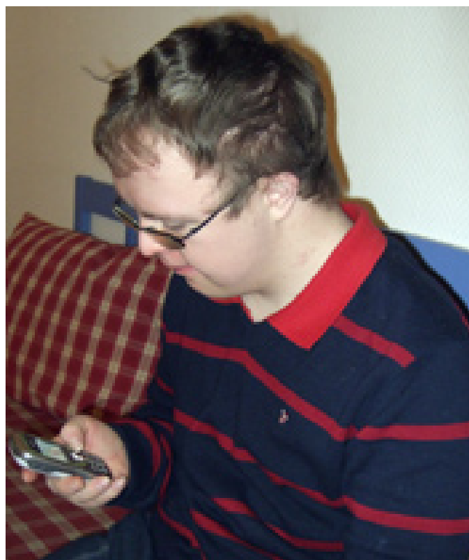
Ungdom er opptatt av mobiltelefon.

Å kunne ta og bruke digitale bilder er også noe som personer med utviklingshemning vil kvie seg for å gjøre uten opplæring. Generelt husker man bedre situasjoner, steder og mennesker