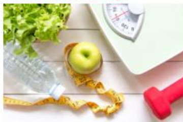
Inntak av energi