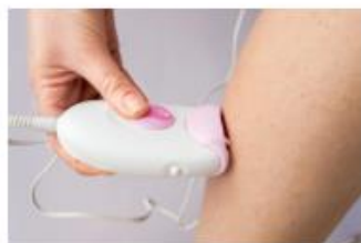
Barbere seg ♀